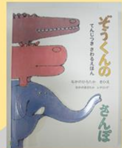
点字付さわる絵本