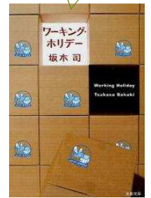
『ワーキングホリデー』坂木司著 文春文庫