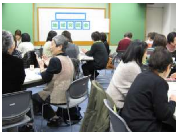
子どもと本をつなぐ地域交流会 平成23年（2011年）1月21日