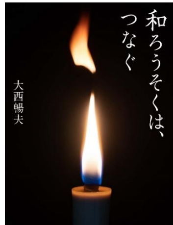
大西 暢夫／著 アリス館