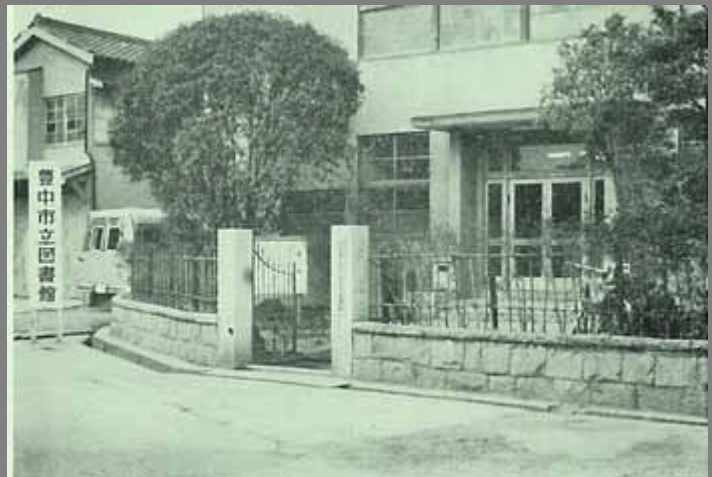
岡町図書館（昭和 40 年頃）