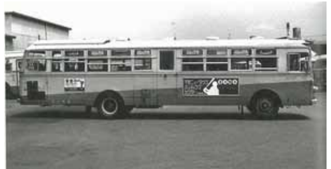
阪急バス(昭和40年代)