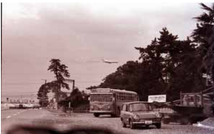
豊中市民会館前(昭和45年)