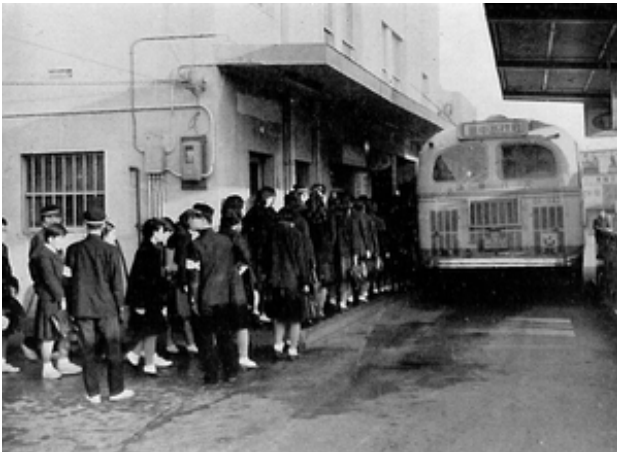
豊中駅バス乗り場(昭和36年)