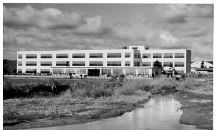
大商学園高等学校全景(昭和34年)