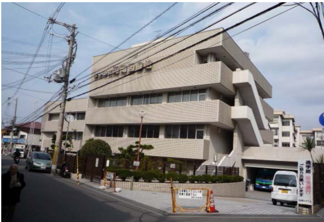
豊中市立岡町図書館